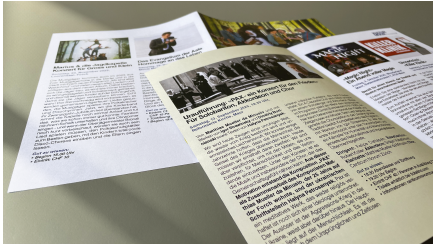
Thomas Hügli - Text GEBO Druck AG - Druck / Ausrüsten